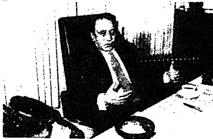
اليهود بغالبيتهم الساحقة يتطلعون الى التقارب مع العرب